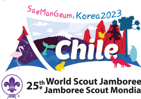
IMAGEN DE CONTINGENTE NOMBRES UNIDADES OPORTUNIDADES